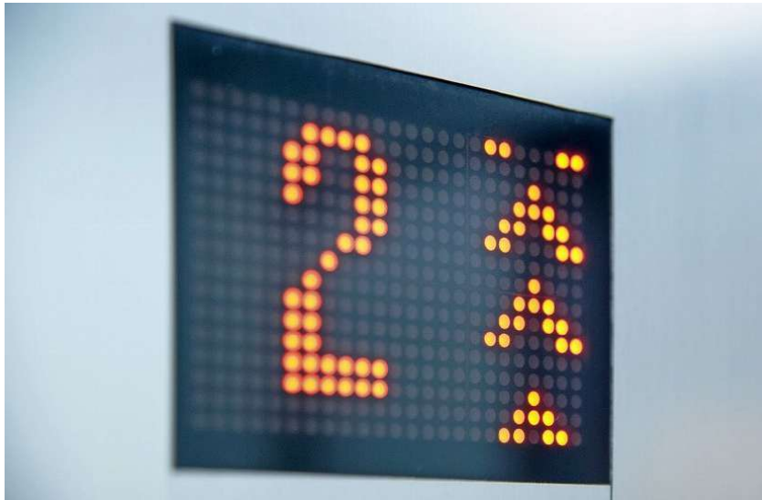
Nimmt ein CEO den Lift nach oben ins VR-Präsidium, birgt das Gefahren. Nicht selten bringt ein solcher Wechsel aber klare Vorteile.

Panalpina streicht rund um das Thema Kontinuität einen zentralen Punkt heraus: Der für die VR-Spitze vorgeschlagene CEO