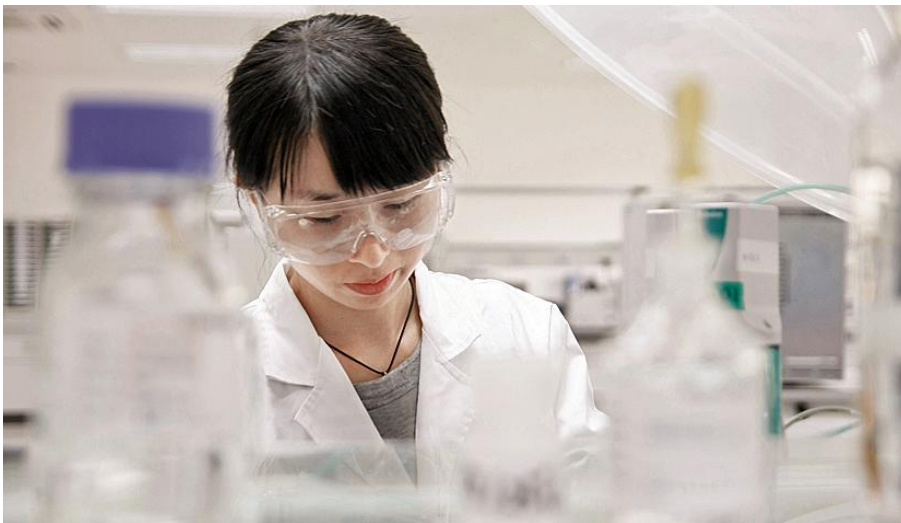
Eine Mitarbeiterin in einem Labor von Lonza.