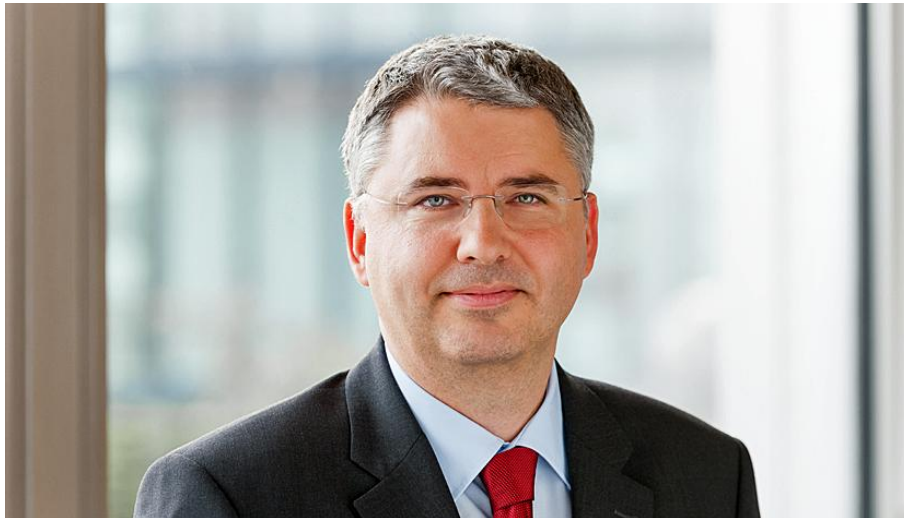
Roche-CEO Severin Schwan.