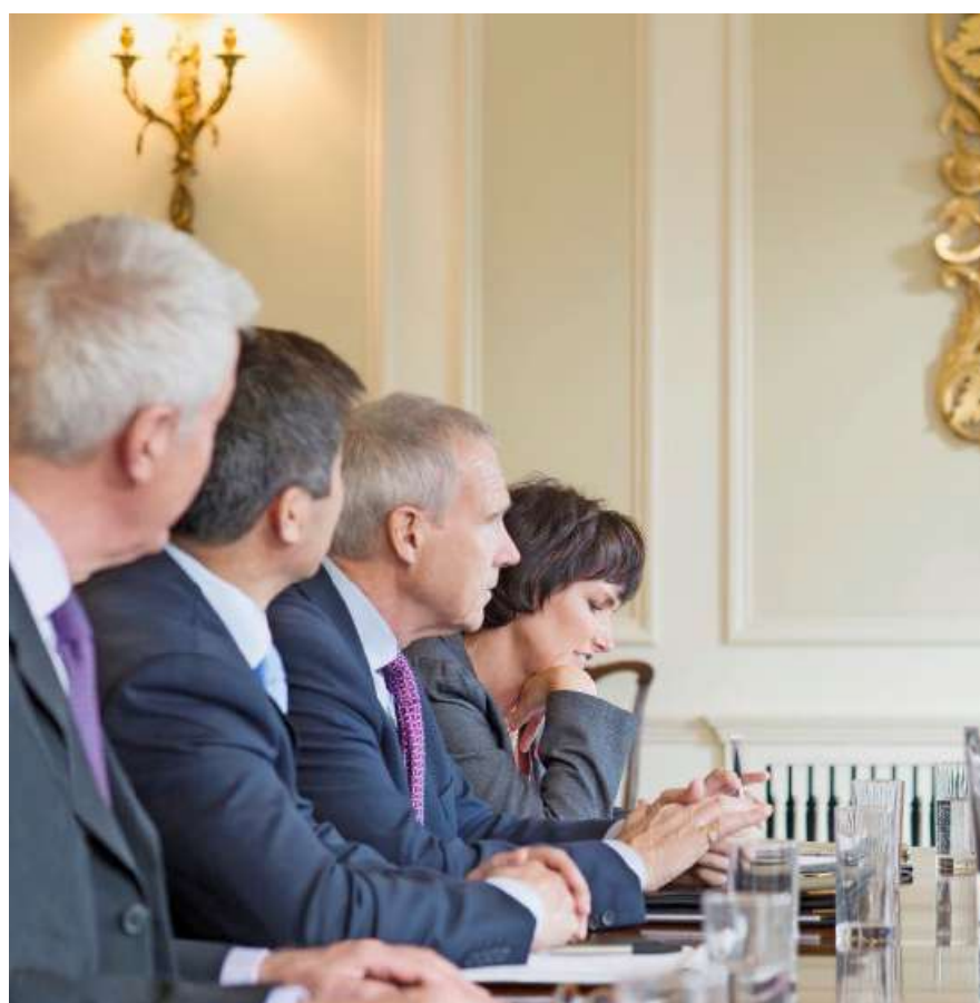
Ein Ziel der Initiative: Mindestens eine Frau in Gremien mit bis zu fünf Mitgliedern.

Dass das Aktienrecht nicht der richtige Ansatzpunkt für Gesellschaftspolitik ist,