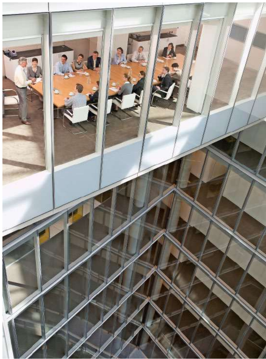
In 45 der 205 SPI-Unternehmen sitzt der CEO auch im Verwaltungsrat.